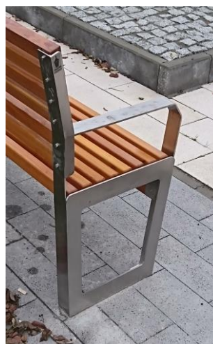
Foto 1. Detal designu istniejącej ławki (profil stalowy, boczny) zamontowanej na płycie Rynku w Rozwadowie-Stalowej Woli.

Przykładowy szkic koncepcyjny EKO-Punktu nawiązujący do istniejących ławek zamontowanych na zrewitalizowanej płycie Rynku w Rozwadowie-Stalowej Woli